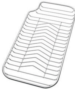
Grille porte-assiettes inox 8100 115