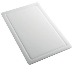
Planche de découpe en HPDE 8657 001