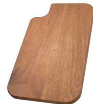
Planche de découpe en bois Iroko 8643 115